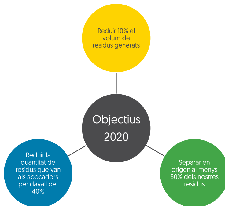
Il·lustració 1: Objectius a aconseguir abans del 2020

En conjunt, el COR gestiona 135.000 tones anuals de Residus Sòlids Urbans i dóna servei a més de 350.000 ciutadans, amb un pressupost al voltant de 14 milions d'euros. El Consorci està integrat per la Generalitat Valenciana, la Diputació de València i els municipis que hi formen part.